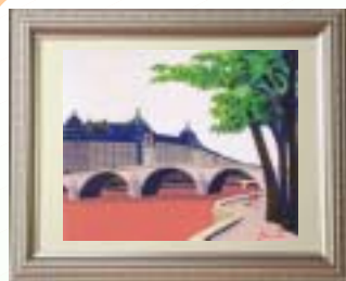
「ロイヤル森の眺め」15F 油彩